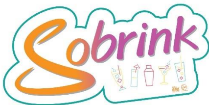
Sticker 10 x 4.9

*** Art work อาจจะมีการปรับเปลี่ยนอีกครั้งตามความเหมาะสม