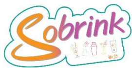
Sticker 5 x 2.5

*** Art work อาจจะมีการปรับแบบอีกครั้งตามความเหมาะสม