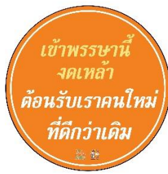
Sticker 12 x 12

*** Art work อาจจะมีการปรับเปลี่ยนอีกครั้งตามความเหมาะสม